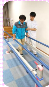
←平行棒を使用してリハビリを行う様子

リハビリ専用の機能訓練室を2部屋用意し、専門スタッフとして 理学療法士、作業療法士 を配置しています。理学療法士等が利用者の方の身体状況を評価し、生活課題や目標を明確にして個別計画を作成。その計画にもとづいて個別リハビリを行っています。自宅等の環境設定や福祉用具の選定などでお困りのときにもお気軽にご相談ください。