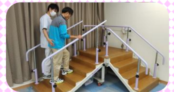
↑階段昇降のリハビリを行う様子