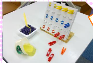
作業療法プログラム

地域リハビリセンター「あいあい」では、 作業療法士や認知症介護実践者研修修了者 といった専門スタッフを配置し、さまざまな 認知症予防プログラム への取り組みを通して、利用者の方が 楽しみを感じながら認知症を予防 できるよう努めています。