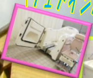
（チェアインバス・寝浴）