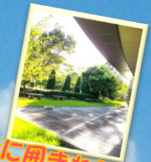
緑に囲まれた中庭