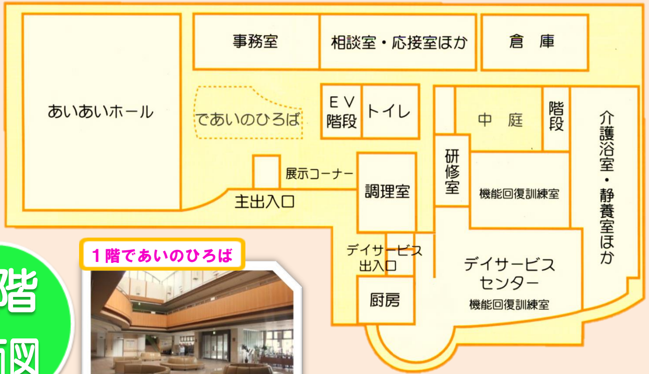
1階であいのひろば